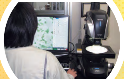
デジタル実体 顕微鏡